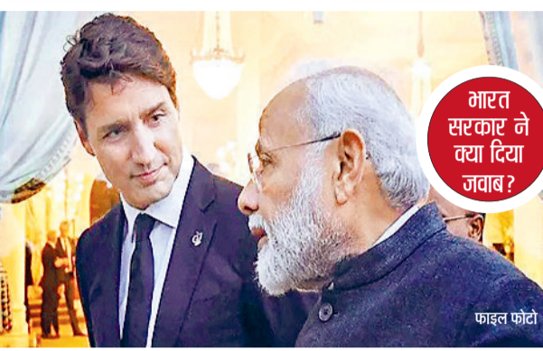
भारत सरकार ने क्या दिया जवाब?

2 भारत ने कई बार निज्जर के प्रत्यागण की मांग की थी, लेकिन कनाडा ने न सिर्फ उसे शरण दी, बल्कि नागरिकता भी दी