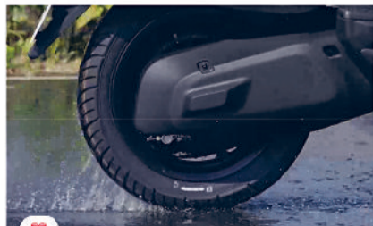
स्क़िड कंट्रोल टेक्नोलॉजी