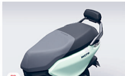
बड़ी सीट ∞