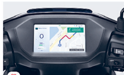
Google Maps Platform