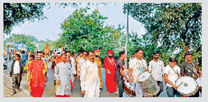
...इसलिए चढ़ाई जाती है शराब

हिंदू पंचांग के अनुसार काल भैरव जयंती मार्गशीर्ष मास के कृष्ण पक्ष की अष्टमी तिथि मनाते हैं। मान्यताओं के अनुसार, काल भैरव तामसिक प्रकृति के देवता माने जाते हैं, इसलिए उन्हें मंदिर या शराब का भोग लगाया जाता है। असल में काल भैरव के मंदिर में शराब चढ़ाना संकल्प और शक्ति का प्रतीक माना जाता है। काल भैरव युद्ध के मैदान में ही रहते हैं। आसुरी प्रवृत्तियों से युद्ध करते हैं, इस कारण इन्हें तामसिक चीजें अर्पित की जाती हैं।